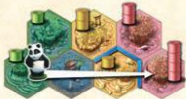
Bewegung des Pandas

Auf dem Beet, auf dem er anhält, frisst der Panda 1 Bambusstück. Gefressene Bambusstücke legt man auf seine Spielertafel. Sie dienen dazu, die „Panda“-Aufgaben zu erfüllen.