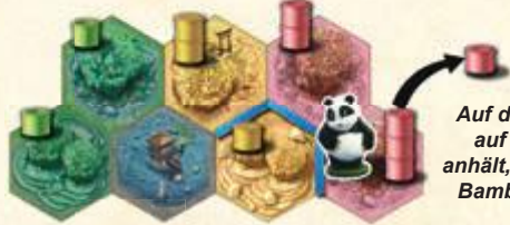
Auf dem Beet, auf dem er anhält, frisst er 1 Bambusstück